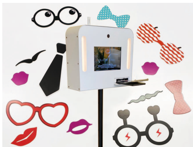
Fotobox mit Accessoires mieten