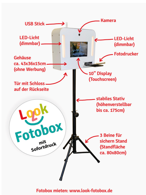
Ausstattung der Fotobox

1-3 Tage vor der Party in Pommerby. Bei kurzfristiger Buchung wird die Look-Fotobox auf Wunsch auch als Expresslieferung nach Pommerby verschickt, sodass die Fotobox garantiert 1 Tag nach der Bestellung geliefert wird.