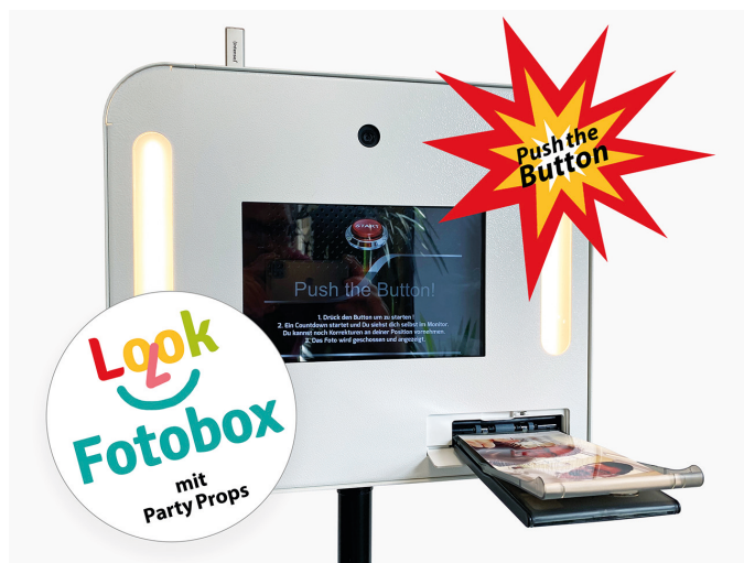
Fotobox mit eingebautem Drucker und Sofortdruck