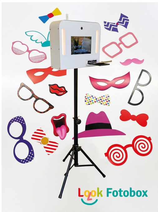
Fotobox mit Fotorequisiten für die Hochzeit