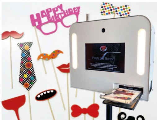
Fotobox mit Fotorequisiten für Geburtstagsparty