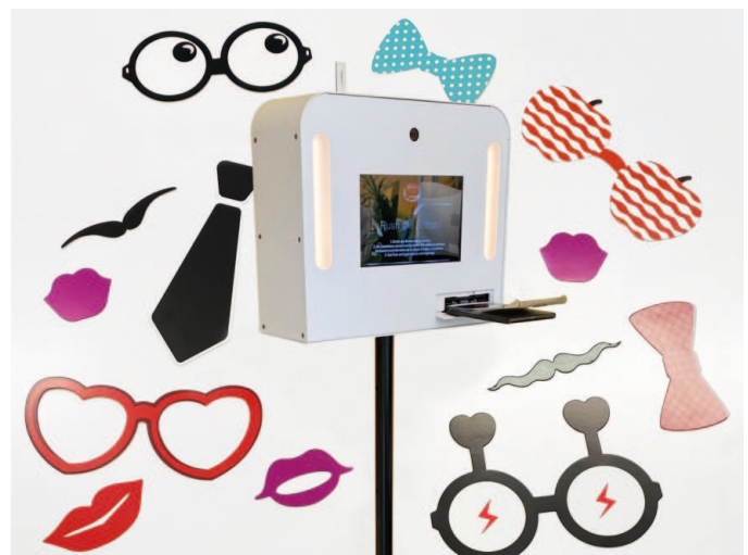
Fotobox mit Accessoires mieten