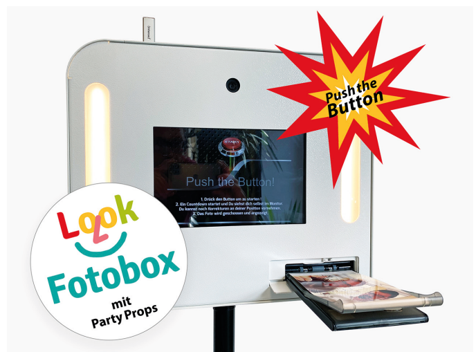
Fotobox mit eingebautem Drucker und Sofortdruck