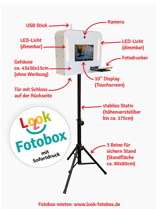
Ausstattung der Fotobox

in einer stabilen und gepolsterten Verpackung rechtzeitig 1-3 Tage vor der Party in Klein Rheide. Bei kurzfristiger Buchung wird die Look-Fotobox auf Wunsch auch als Expresslieferung nach Klein Rheide verschickt, sodass die Fotobox garantiert 1 Tag nach der Bestellung geliefert wird.