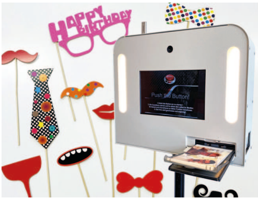
Fotobox mit Fotorequisiten für Geburtstagsparty