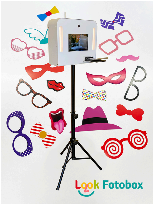
Fotobox mit Fotorequisiten für die Hochzeit