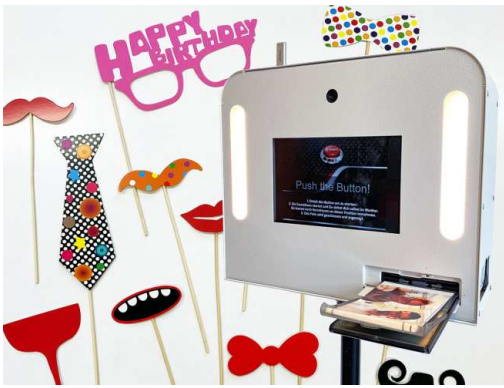
Fotobox mit Fotorequisiten für Geburtstagsparty