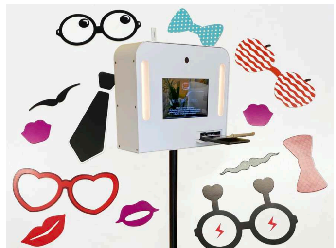
Fotobox mit Accessoires mieten