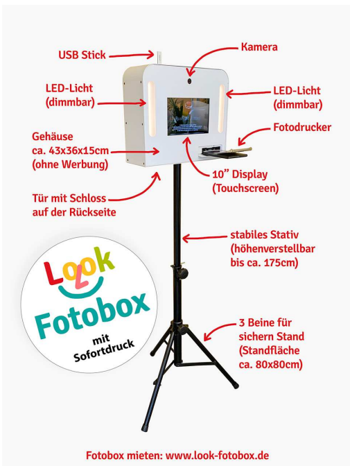
Fotobox mieten: www.look-fotobox.de