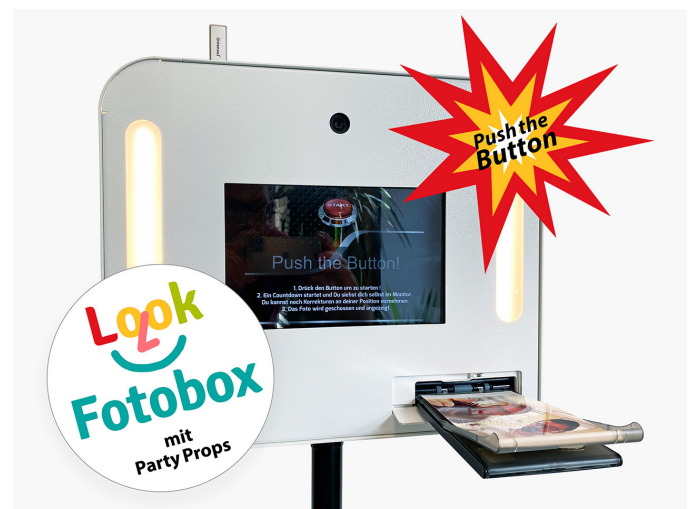
Fotobox mit eingebautem Drucker und Sofortdruck