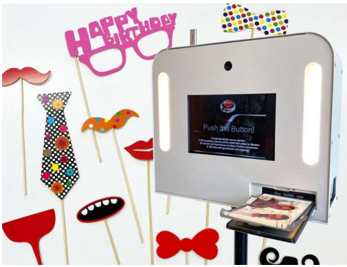
Fotobox mit Fotorequisiten für Geburtstagsparty