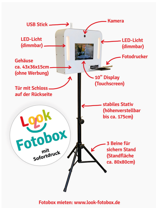
Ausstattung der Fotobox

in einer stabilen und gepolsterten Verpackung rechtzeitig 1-3 Tage vor der Party in Haltern am See. Bei kurzfristiger Buchung wird die Look-Fotobox auf Wunsch auch als Expresslieferung nach Haltern am See verschickt, sodass die Fotobox garantiert 1 Tag nach der Bestellung geliefert wird.