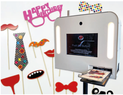
Fotobox mit Fotorequisiten für Geburtstagsparty